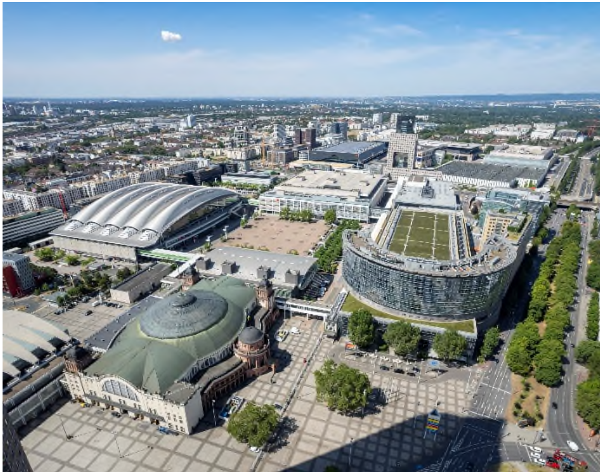
Messe Frankfurt – Überblick Gelände

Der Deutsche Nachhaltigkeitspreis wird von der Stiftung Deutscher Nachhaltigkeitspreis vergeben, in diesem Jahr zum 16. Mal. Er prämiiert Beiträge zur Transformation in eine nachhaltige Zukunft und berücksichtigt dabei vor allem ökologische und soziale Aspekte. Der Preis gilt als Europas größte Auszeichnung für ökologisches und soziales Engagement. In diesem Jahr sind Unternehmen aus 100 Branchen nominiert, die auf lange Sicht vorbildliche und wirksame Beiträge zur nachhaltigen Transformation liefern. Zusammen mit der Messe Frankfurt sind unter anderem die Hamburg Messe und Congress, die NürnbergMesse und die Messe Stuttgart in der Kategorie „Freizeit und Veranstaltungen“ für die Branche „Veranstaltungs- und Messegewirtschaft“ nominiert. Die Auszeichnungen erfolgen in Zusammenarbeit mit der Deutschen Industrie- und Handelskammer (DIHK), dem Bundesumweltministerium und weiteren Partner*innen. Die Verleihung findet am 23. November 2023 in Düsseldorf statt.