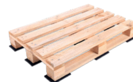
Abb. 5

Hier finden Sie weiterführende Informationen und Bestellmöglichkeiten für Antirutschmatten.