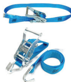
Abb. 6

Für eine zusätzliche Befestigung eignen sich Zurrgurte. Diese gibt es in verschiedenen Varianten und von verschiedenen Herstellern.