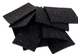
Abb. 4, Bild: www.antirutschmatte24.de

Bitte beachten Sie, dass die Antirutschmatten vollflächig unter den Stützen und Ballastgewichten verlegt werden müssen.