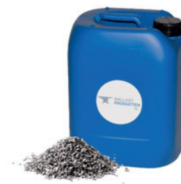
Abb. 3, Bild: www.ballast-produkte.de

Hier finden Sie weiterführende Informationen und Bestellmöglichkeiten für Kanister.