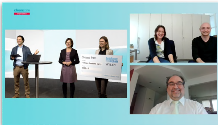
Cleanzone Award: Siegerehrung